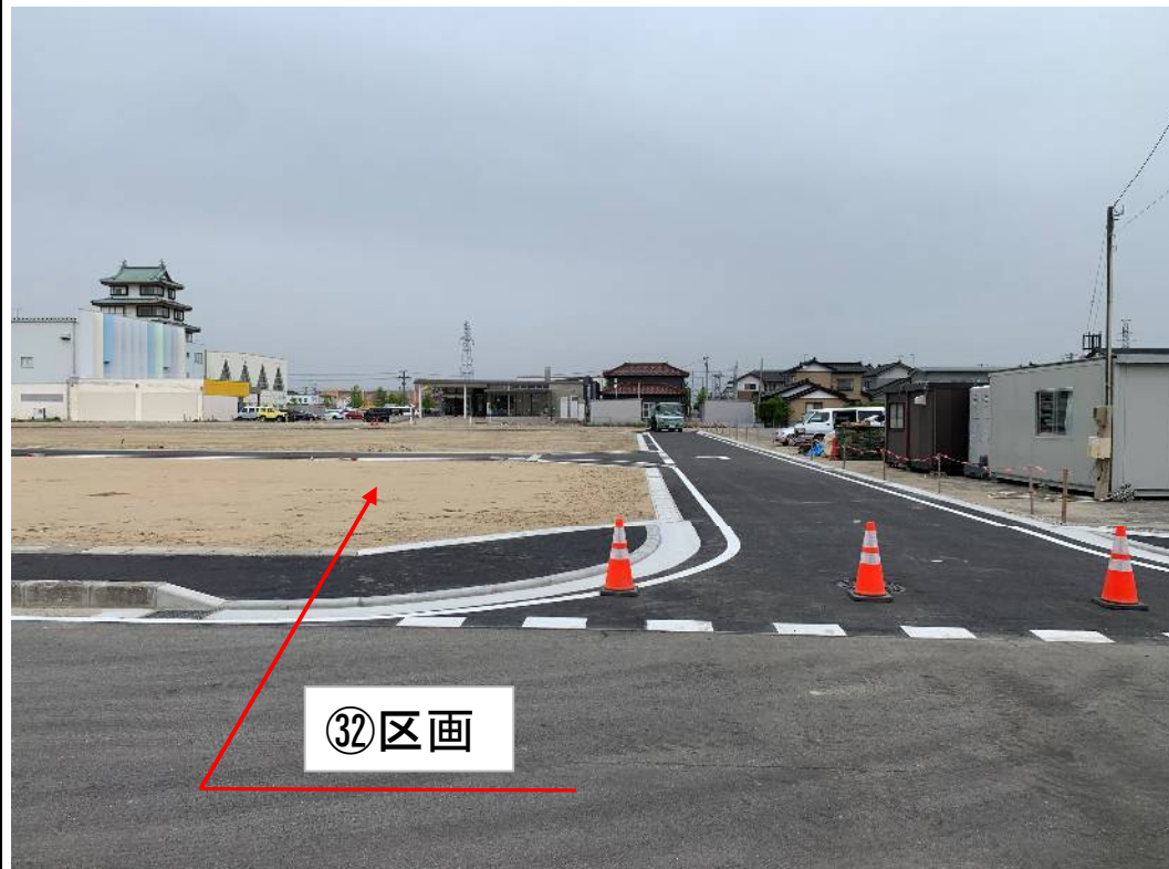
南側から見た土地状況