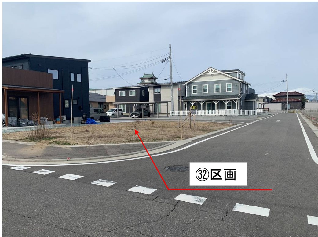
南側から見た土地状況